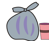
Sacos e copos plásticos De 200 a 450 anos